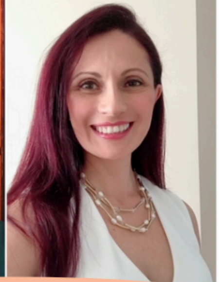
MONICA BELTRAN ESPITIA

Ministra Plenipotenciaria de Carrera Diplomática y Consular de Colombia